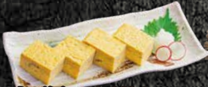
寿司屋の玉子焼き 580円