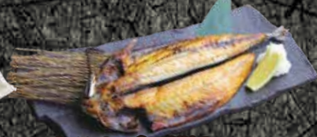
とろさばの開き 980円