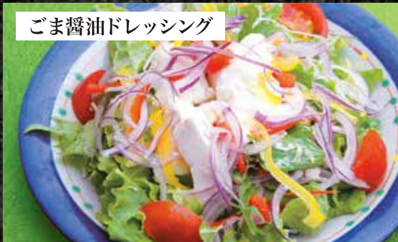
ごま醤油ドレッシング 豆腐のヘルシーサラダ 720円

たこぶつ 680円 酢の物盛り合わせ 700円 たこ吸盤酢の物 500円 もずく酢 400円 いか塩辛 400円 かに味噌きゅうり 550円 漬け物盛り合わせ 500円 枝豆 420円