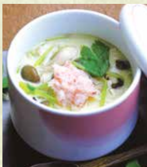
総本店の茶碗蒸し 550円