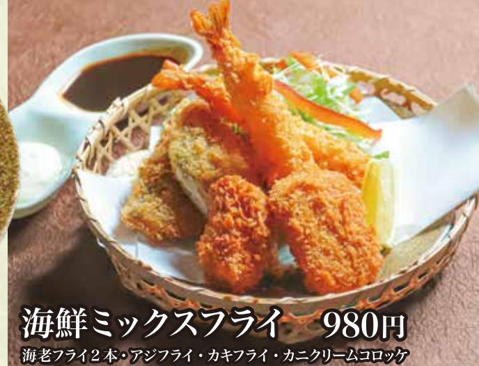
海鮮ミックスフライ 980円 海老フライ2本・アジフライ・カキフライ・カニクリームコロッケ