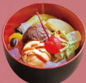
クリームあんみつ 580円