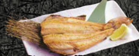
縞ほっけの開き 一尾 980円 半身 590円