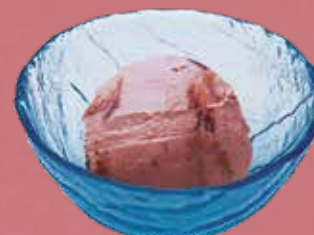
ガトーショコラアイス 360円