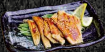
おつまみ煮穴子 880円