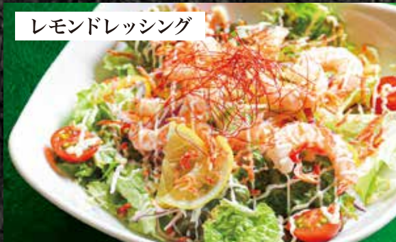
レモンドレッシング 彩り海老サラダ 780円