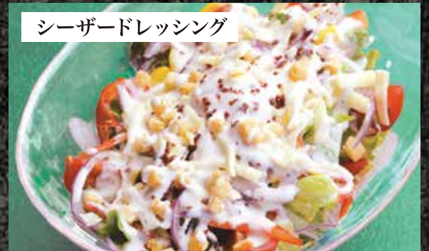
シーザードレッシング 温玉のシーザーサラダ 780円