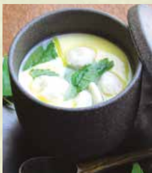
貝柱の茶碗蒸し 520円