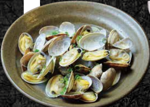
あさりの酒蒸し 800円